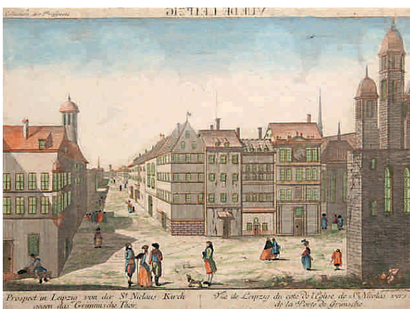
Vista de Leipzig dende o lado da Igrexa de San Nicolás cara á Porta Grimsche.

Con estas ferramentas Bach constrúe a Paixón segundo San Xoán dunha forma eficaz e sublime, xenial, no que diversos universos sonoros conviven co fin de dar vida ao relato que se nos conta. Así, momentos de plenitude como o coro inicial encomiando o Señor «Herr, unser Herrsche!» («Señor, noso soberano»), que resume a mensaxe xeral da obra: «Móstranos por medio da túa Paixón que ti, o verdadeiro fillo de Deus, (...), es glorificado», alternan con momentos dun só de introspección e queixume. A este respecto, un punto álxido da paixón e da partitura atopámolo no aria nº 30 «É ist vollbracht» («Consumouse»),